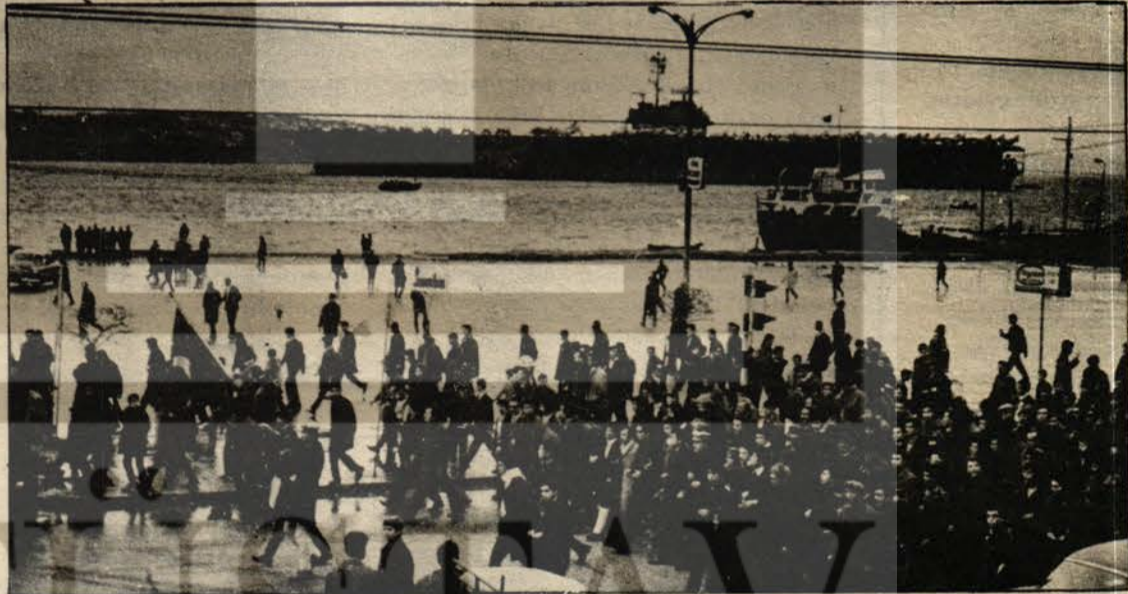
1969'da ABD 6. Filo'sunu protesto gösterileri

"SOL KOMÜNİZM, BİR ÇOCUKLUK HASTALIĞI" Sol Yayımları, İkinci baskı, s. 23-24-25