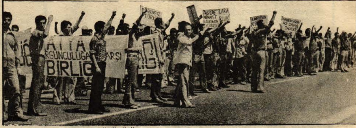
1975 İncirlik BAĞIMSIZLIK YÜRÜYÜŞÜ